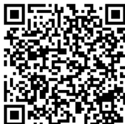
iNTUE 校務整合資訊系統