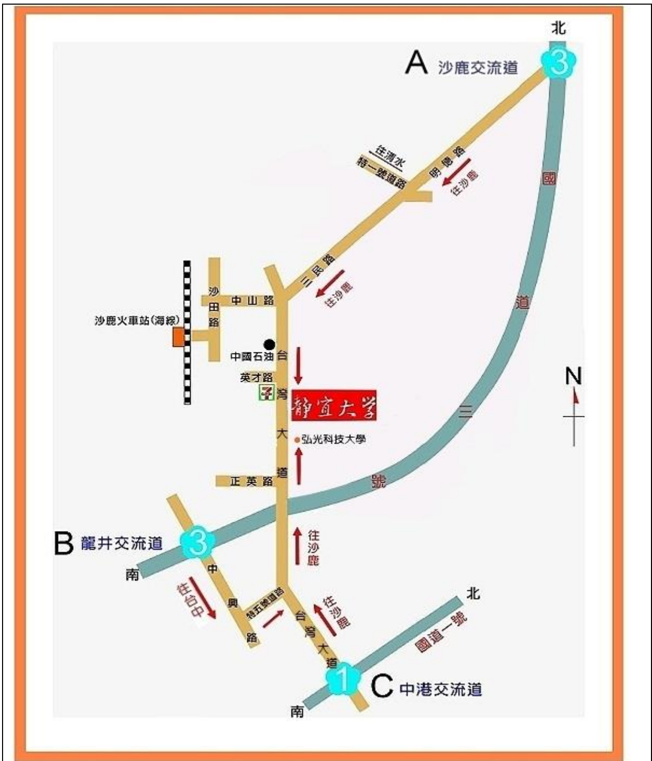
附錄：靜宜大學（臺中市沙鹿區臺灣大道7段200號）交通位置圖

備註：靜宜大學交通資訊，請參考該校網站 https://www.pu.edu.tw/p/404-1000-2733.php?Lang=zh-tw